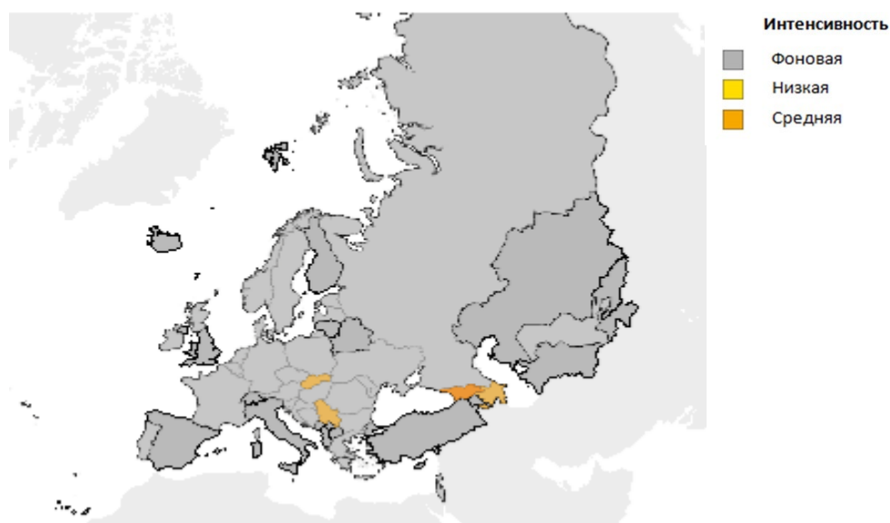
Рисунок 1. Интенсивность активности гриппа в Европейском регионе, неделя 46/2020